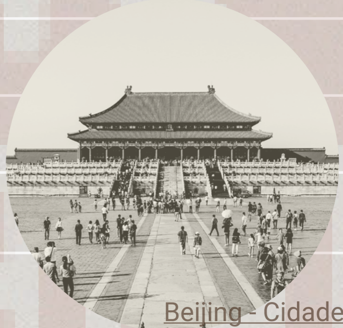
Beijing - Cidade irmã