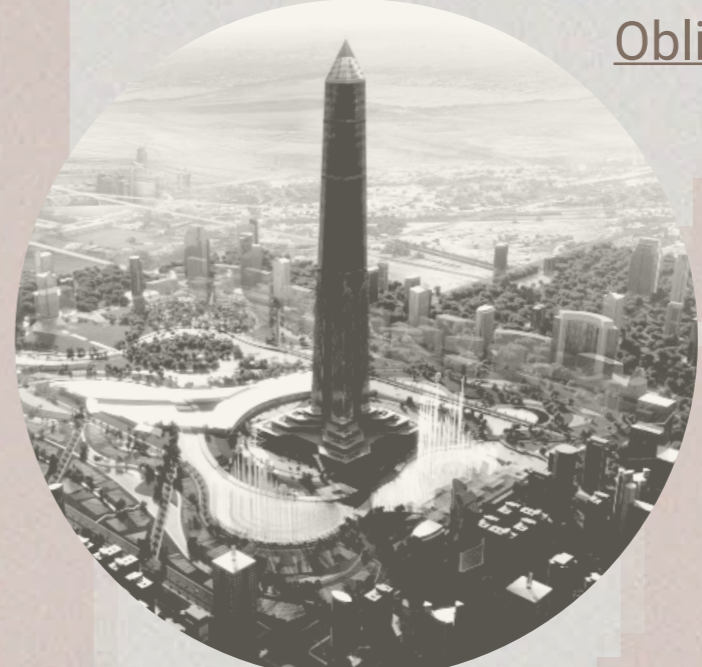
Oblisco Capitale Tower